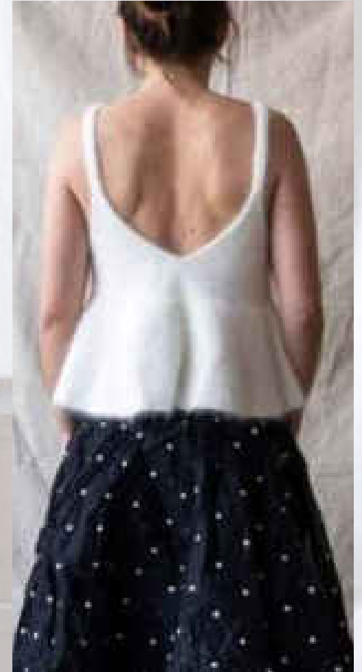
Kiki Noir/blanc TU (Vendu par 3) 85€