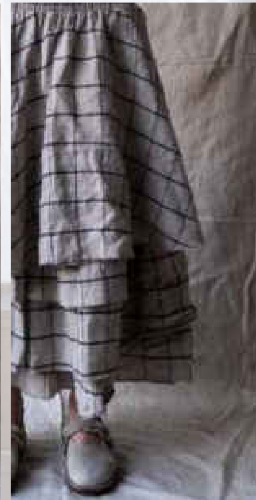
Lucie (Chevron Écru) TU 119€