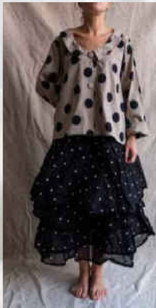
Virginie Pois noir/pois blanc/noir/taupe/écru S - XXL 79€