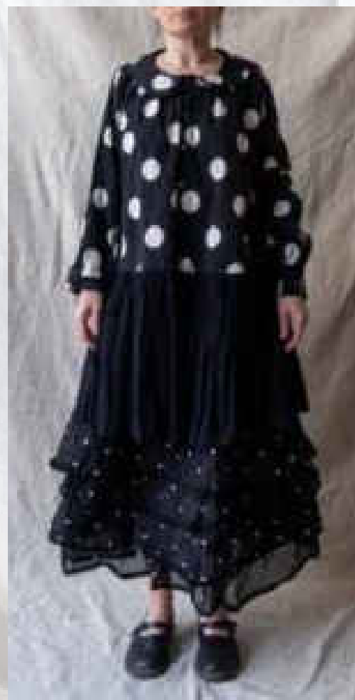
Solange (Chemise boutonnée devant) Pois noir/pois blanc/noir/taupe/écru S - XXL / 89€