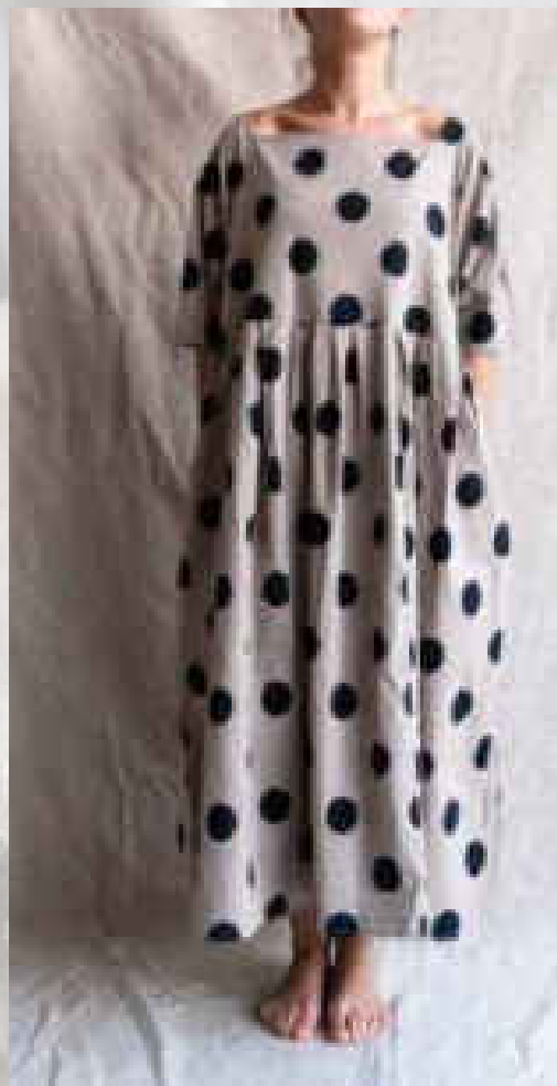
Rose (Robe longue, manches 3/4) Pois noir/pois blanc/noir/taupe/ écru / S - XXL / 99€