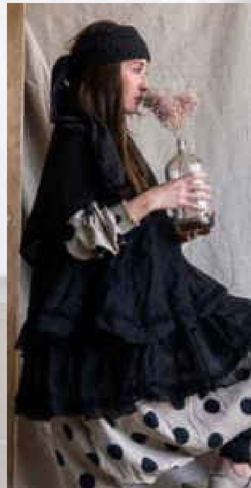
Sonia (Dentelle coton, boutons en nacre) Écru/taupe/rose/noir S - XXL 89€