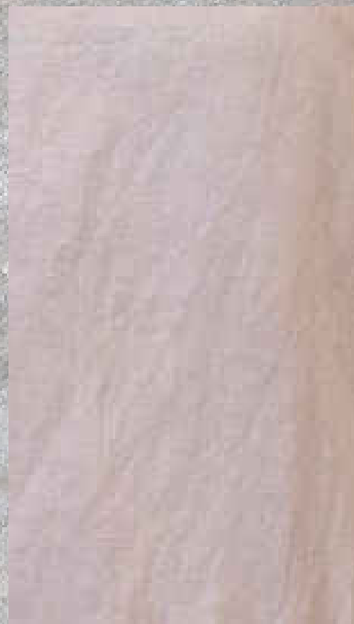
COTON LIN DRAGÉE 50% COTON 50 % LIN