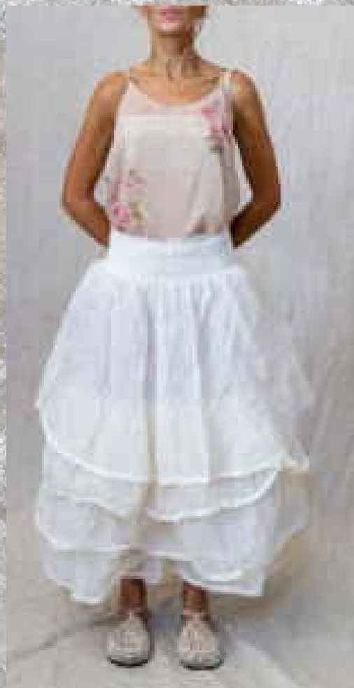
Jupon MADELEINE Organza CRAIE