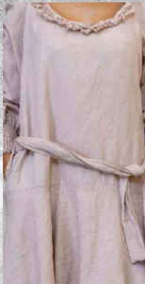
Robe longue TIARÉ DRAGÉE

SAUGE / BOIS DE ROSE DRAGÉE / CRAIE Deux poches intérieures