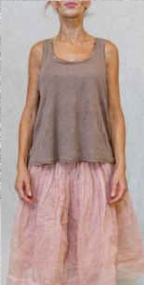
Débardeur PHIL TAUPE 30€ - TU