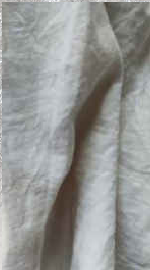
VOILE DE COTON CRAIE 100 % COTON