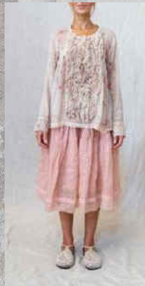
Blouse ANTONE CRAIE