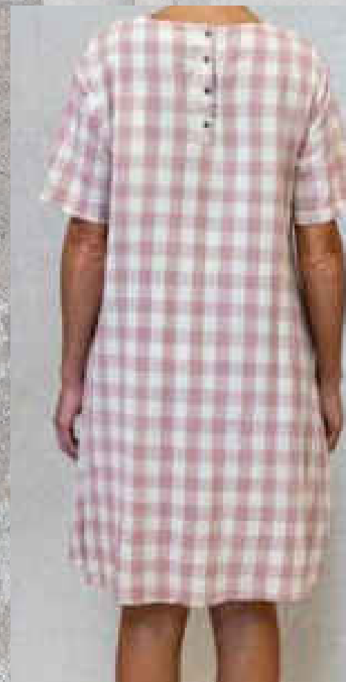
Robe TEATA CARREAUX VERT

CARREAUX VERT CARREAUX ROSE VICHY VERT Deux poches intérieures