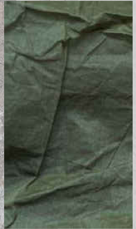
ORGANZA BOIS DE ROSE 100% COTON