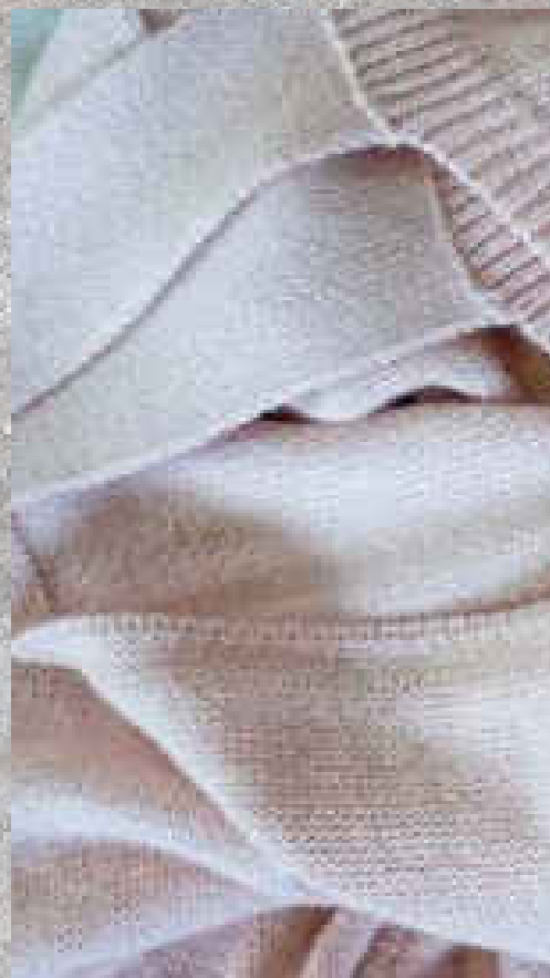
MAILLE ROSE / AMANDE 55% COTON 45% POLYESTER RECYCLÉ