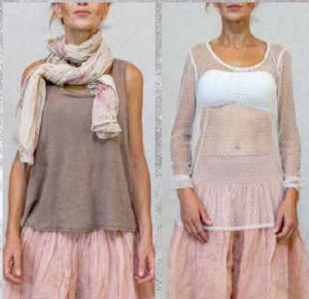
Écharpe PAULINE PRINT 1