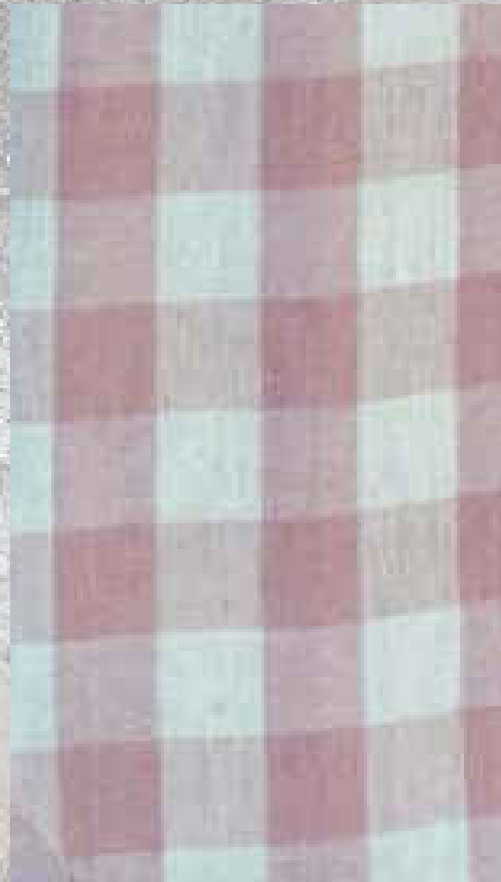
COTON RUSTIC CARREAUX ROSE 100% COTON