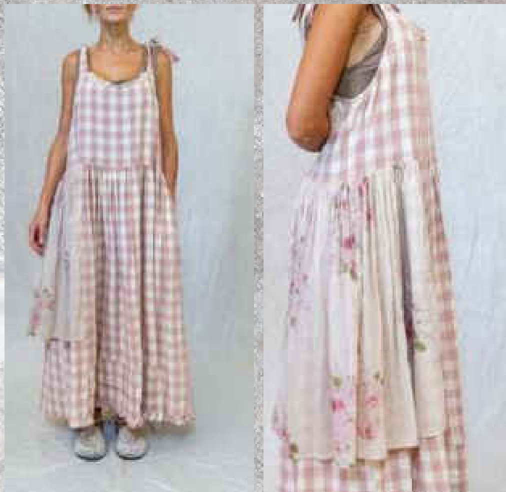
Robe RÉVATUA CARREAUX ROSE