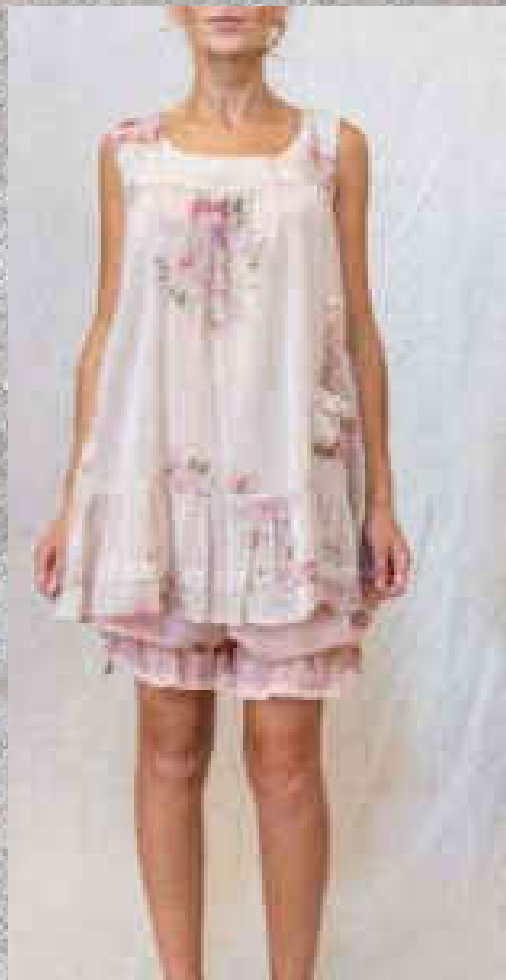
Robe TÉVA PRINT 1