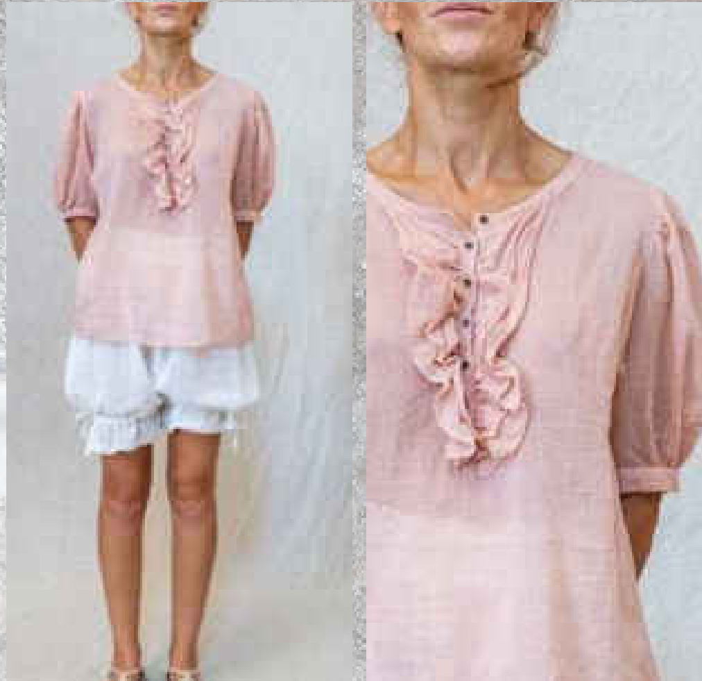
Chemisier OTÉA DRAGÉE

PRINT 1 / PRINT 2 SAUGÉ / BOIS DE ROSE DRAGÉE / CRAIE Élastique manche