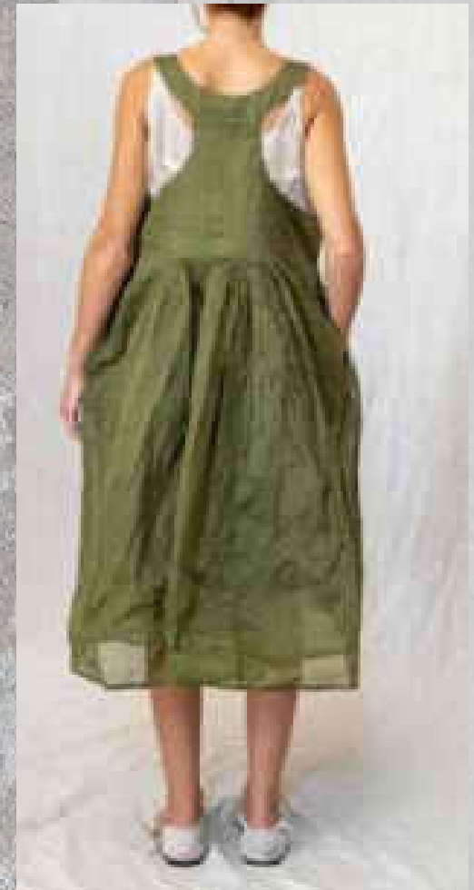
Robe MITI CRAIE

SAUGE / BOIS DE ROSE DRAGÉE / CRAIE Col dentelle coton Deux poches intérieures