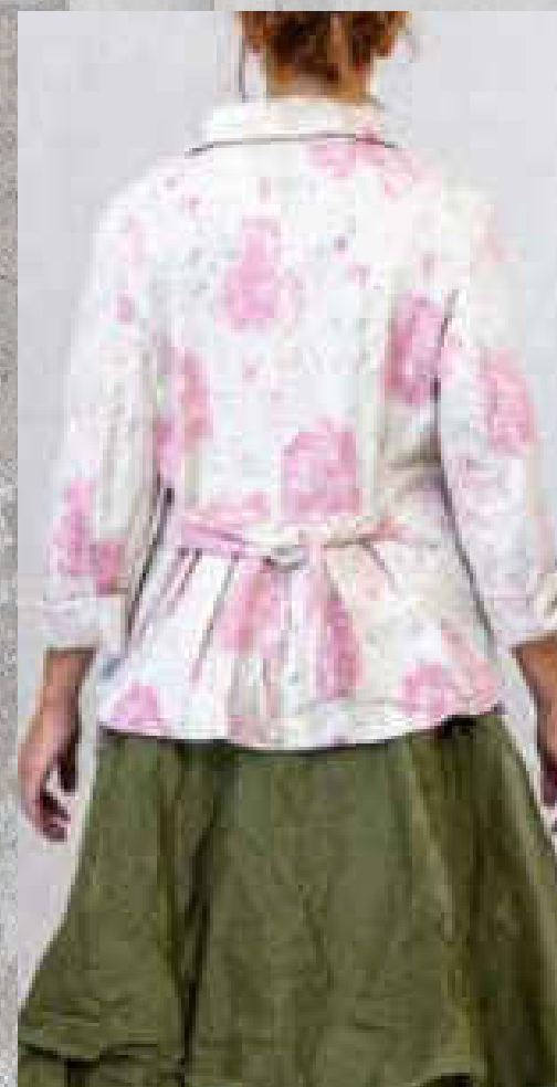
Veste ÉRINA PRINT 1