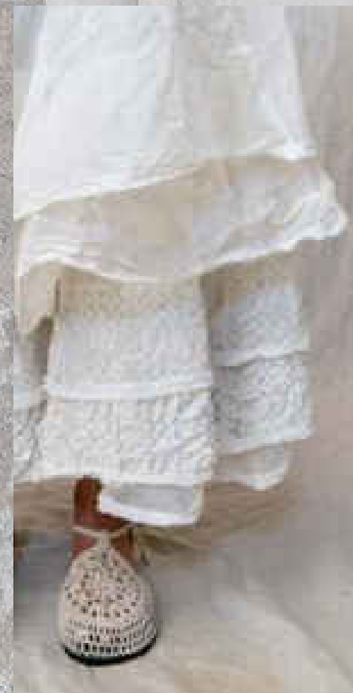
Jupon MADOU Organza SAUGE