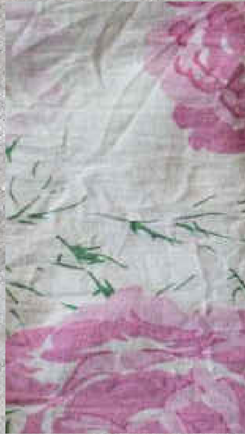
POPELINE PRINT 2 95 % COTON / 5 % ELASTHANE