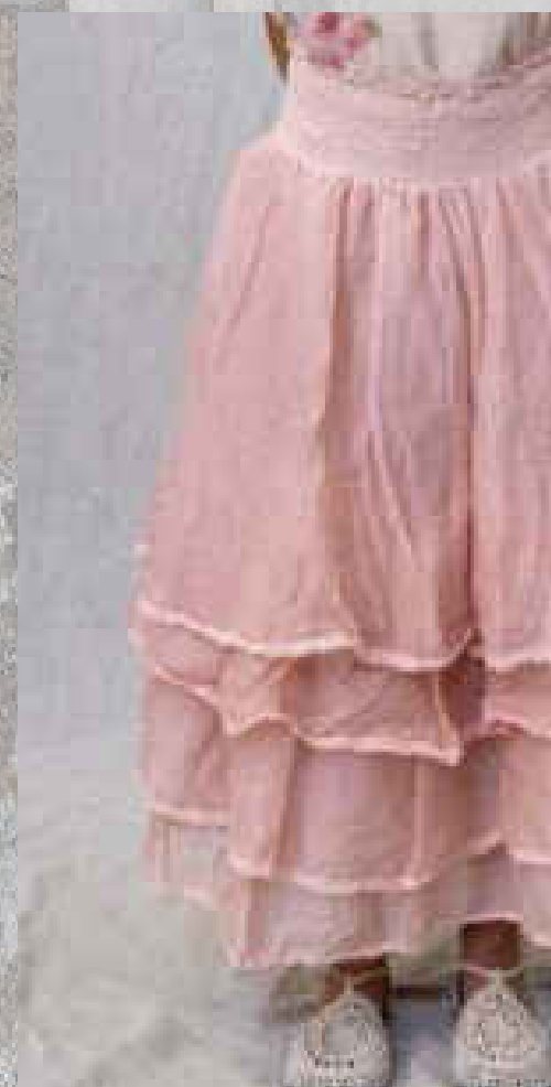
Jupon MADELEINE Organza SAUGE