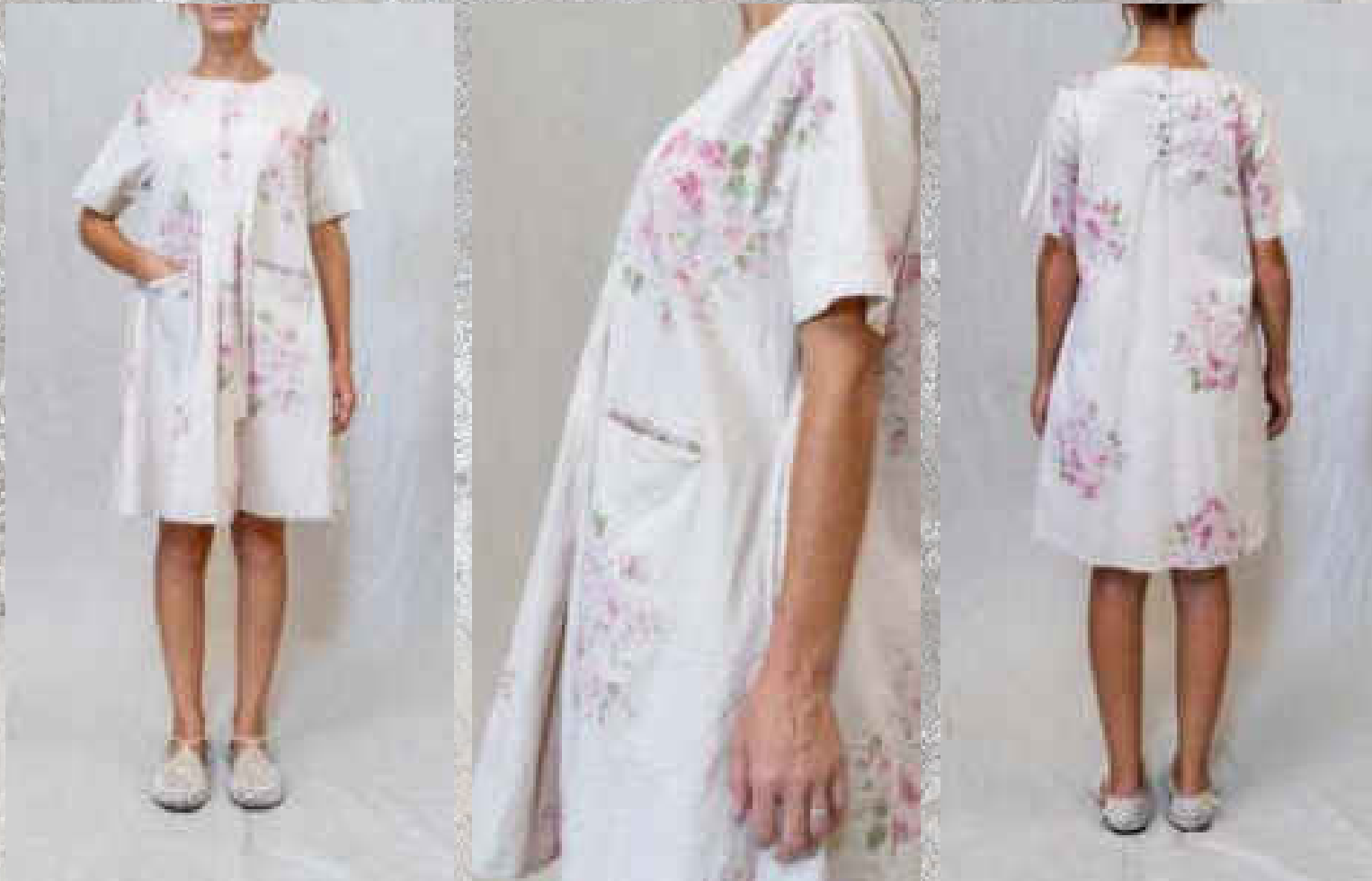
Robe MARIA PRINT 1