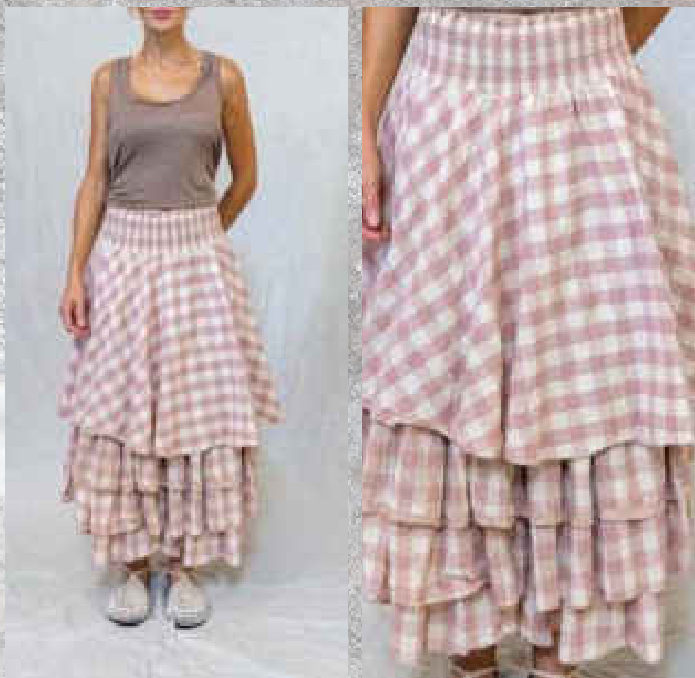
Jupon MADELEINE RUSTIC