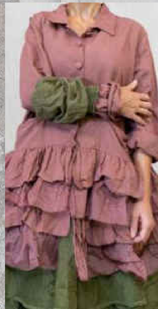
Manchette PRINT 1