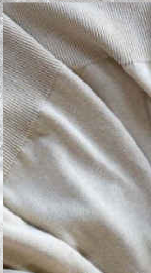
MAILLE CRÈME 55% COTON 45% POLYESTER RECYCLÉ