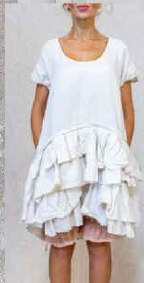
Tunique MANATEA SAUGE