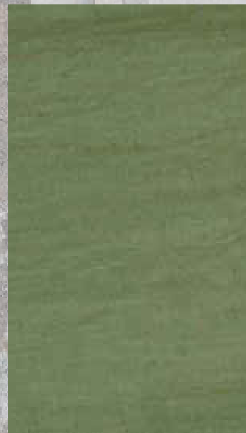
COTON LIN SAUGE 50% COTON 50 % LIN