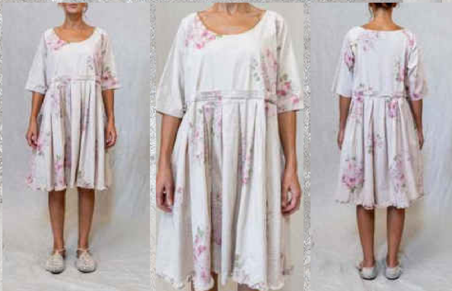
Robe TEATA PRINT 1

PRINT 2 / PRINT 1 UNI SAUGE UNI BOIS DE ROSE Deux poches intérieures