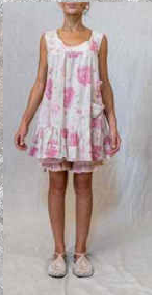
Tunique TÉVA PRINT 2