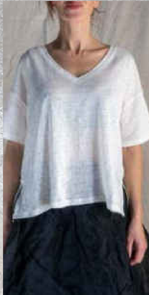
Tee-shirt TOM CRAIE 32€ - TU