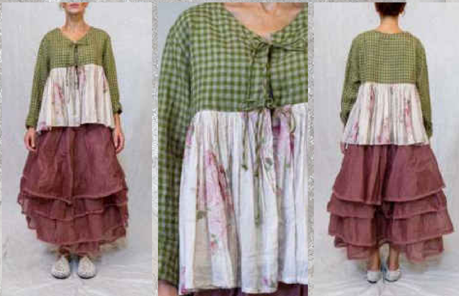
Veste SARAH VICHY VERT / PRINT 1

Deux poches intérieures (Vichy vert, voile de coton)