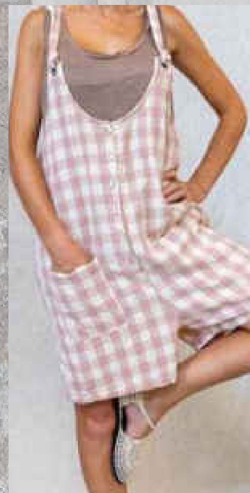
Pantalon GUS CARREAUX VERT