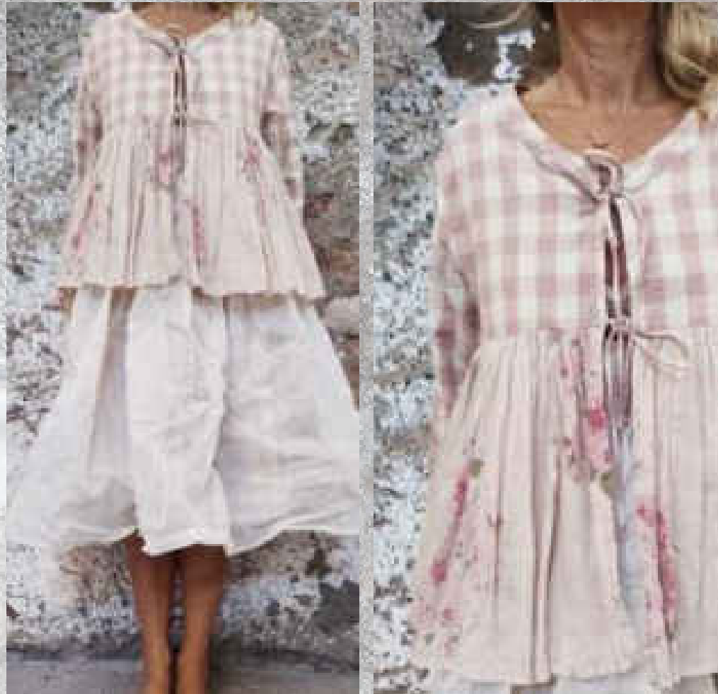
Veste SARAH CARREAUX ROSE / PRINT 1

CARREAUX ROSE - PRINT 1 CARREAUX VERT - PRINT 1 Deux poches intérieures