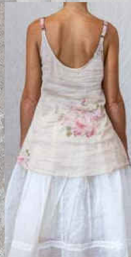
Robe TÉATA CRAIE

PRINT 1 / PRINT 2 SAUGE / BOIS DE ROSE DRAGÉE / CRAIE