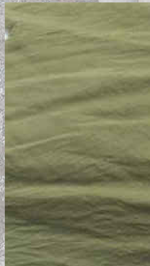
VOILE DE COTON SAUGE 100 % COTON