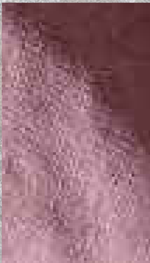
COTON LIN BOIS DE ROSE 50% COTON 50 % LIN