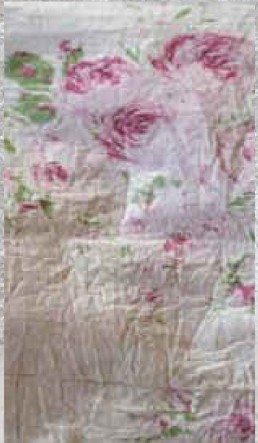
VOILE DE COTON PRINT 1 100 % COTON