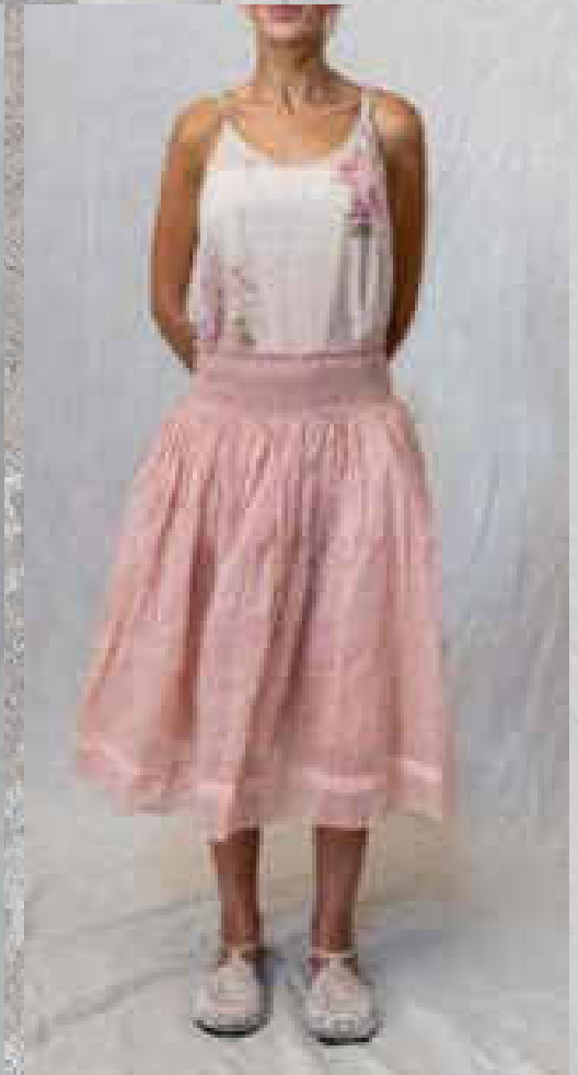
Jupe LOU Organza CRAIE