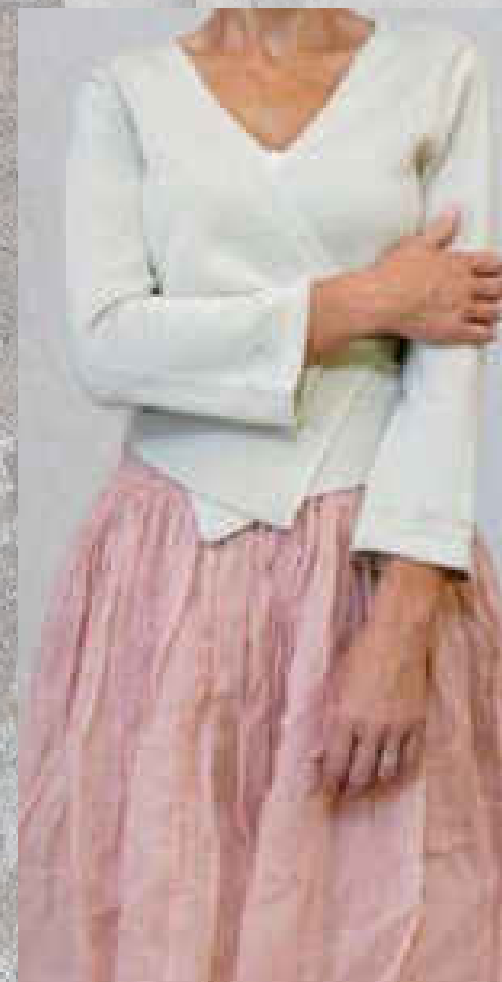
Cache coeur maille SOPHIA ROSE