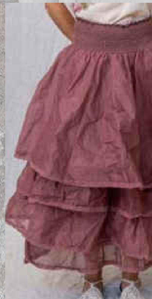
Jupe LOU POPELINE PRINT 2