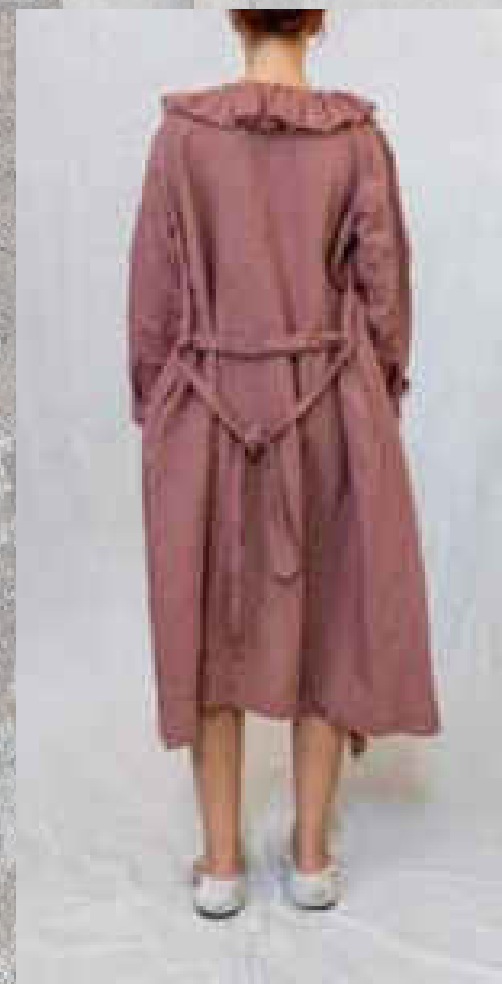
Veste 3/4 INAPO CRAIE