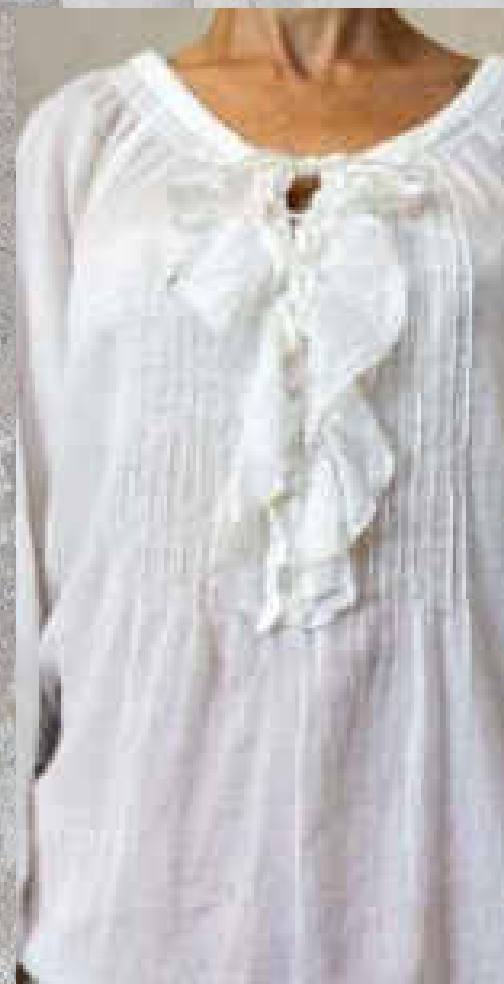
Blouse LOVANA PRINT 2