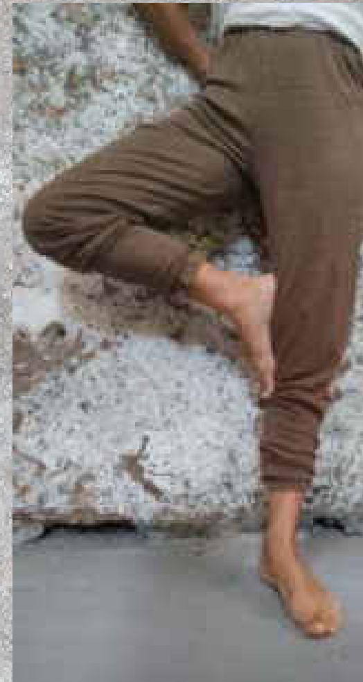
Tee-shirt NOÉ SAUGE manches longues