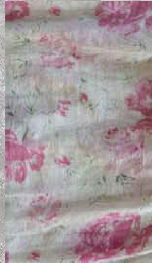
VOILE DE COTON PRINT 2 100 % COTON