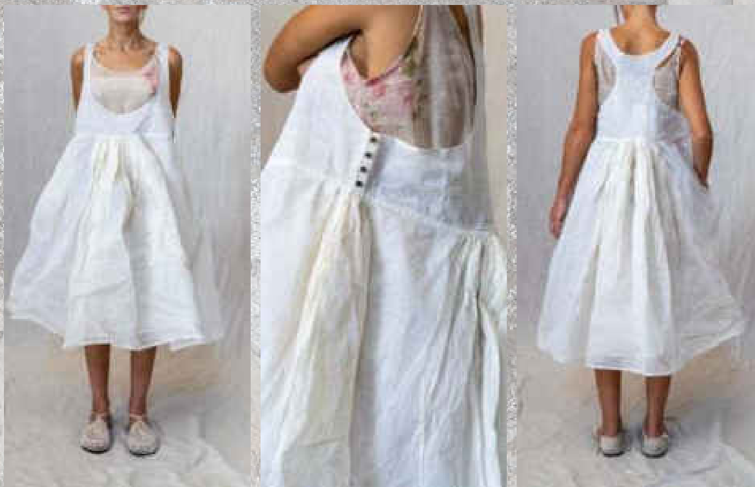
Robe RÉVA CRAIE

SAUGE BOIS DE ROSE DRAGÉE / CRAIE Doublé voile de coton