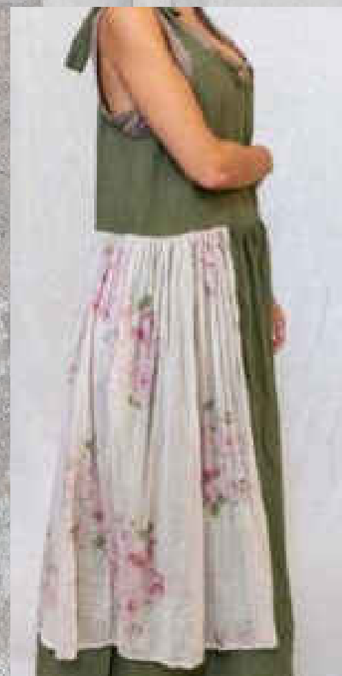
Robe REVATUA BOIS DE ROSE / PRINT 1