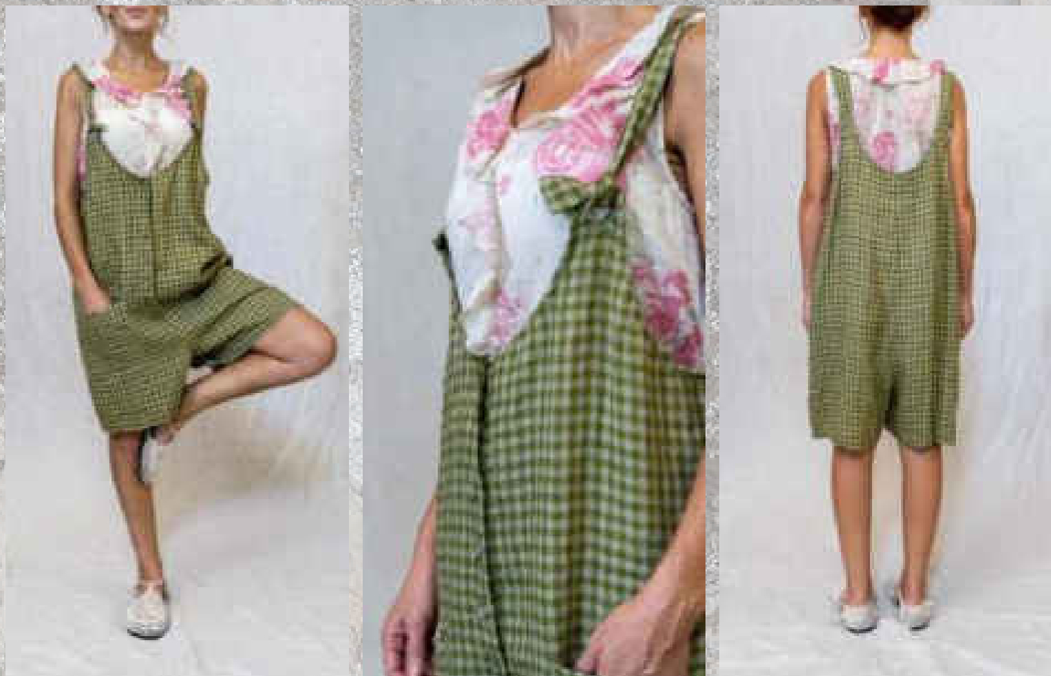
Salopette short 100% Lin PITO VICHY VERT