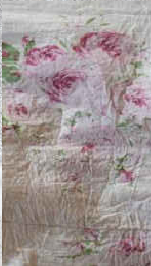
POPELINE PRINT 1 95 % COTON / 5 % ELASTHANE