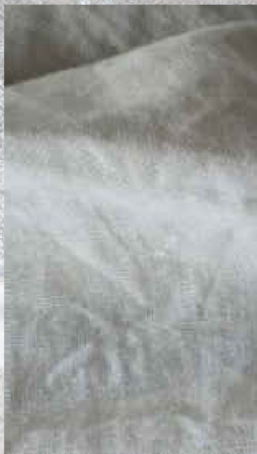
COTON LIN CRAIE 50% COTON 50 % LIN