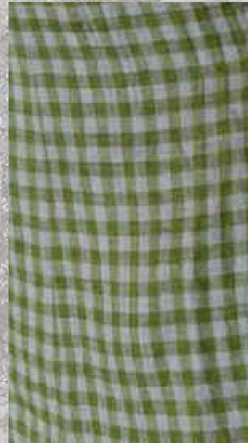
VICHY VERT 100% LIN