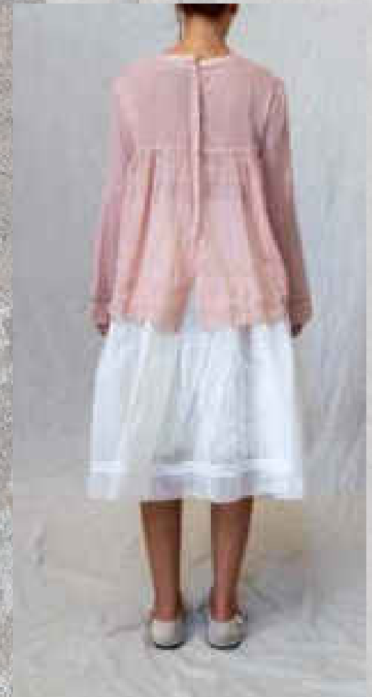
Blouse ANTONE PRINT 2