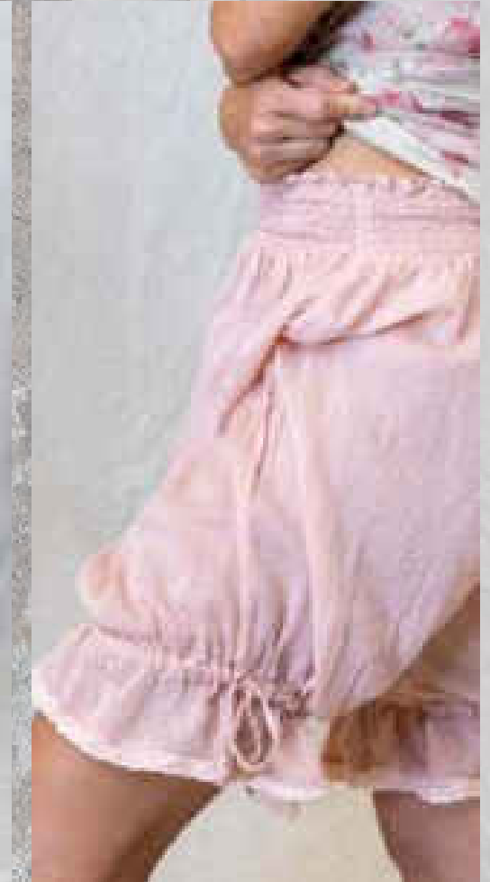
Robe ELISÉ PRINT 1

PRINT 1 / PRINT 2 Deux poches intérieures doublure coton Col dentelle coton