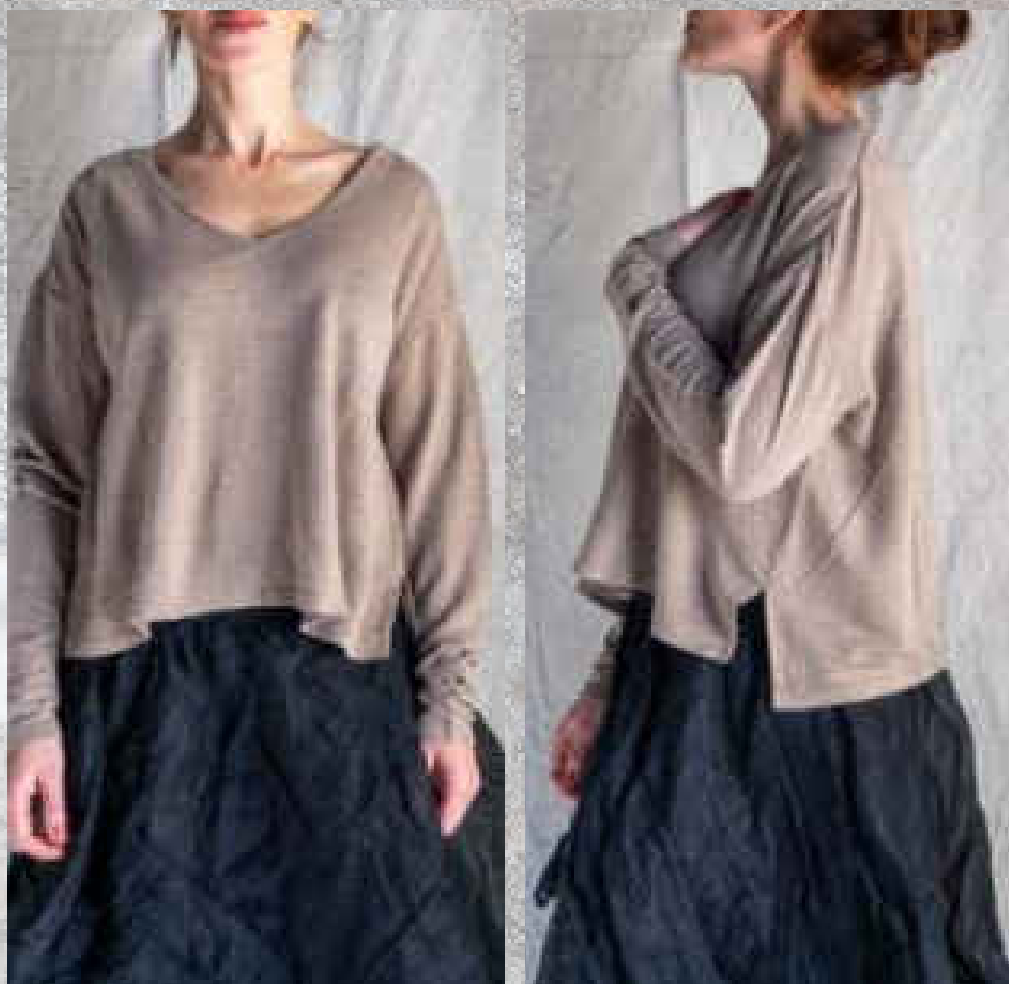
Tee-shirt LINO TAUPE manches longues