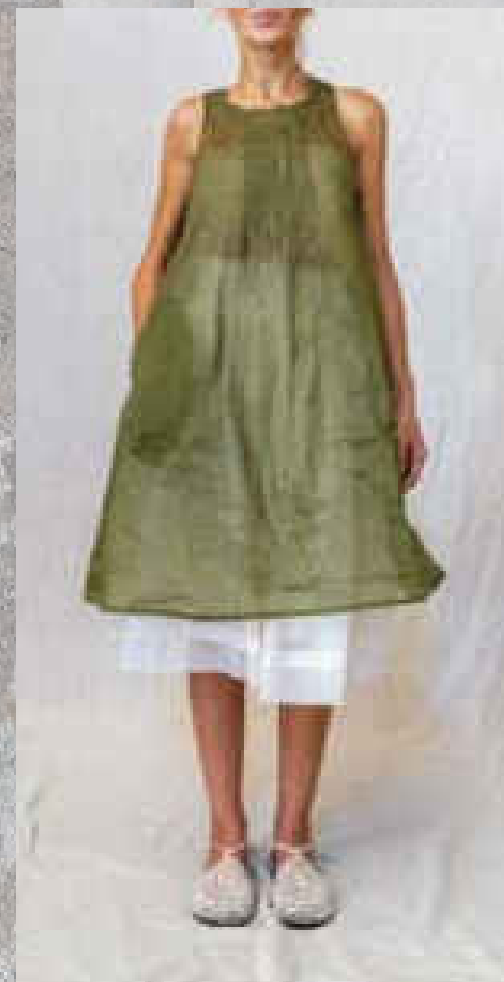
Tunique CÉCILE DRAGÉE