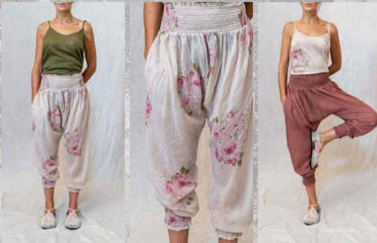
Pantalon FANFAN PRINT 1

PRINT 1 / PRINT 2 SAUGE / BOIS DE ROSE DRAGÉE / CRAIE