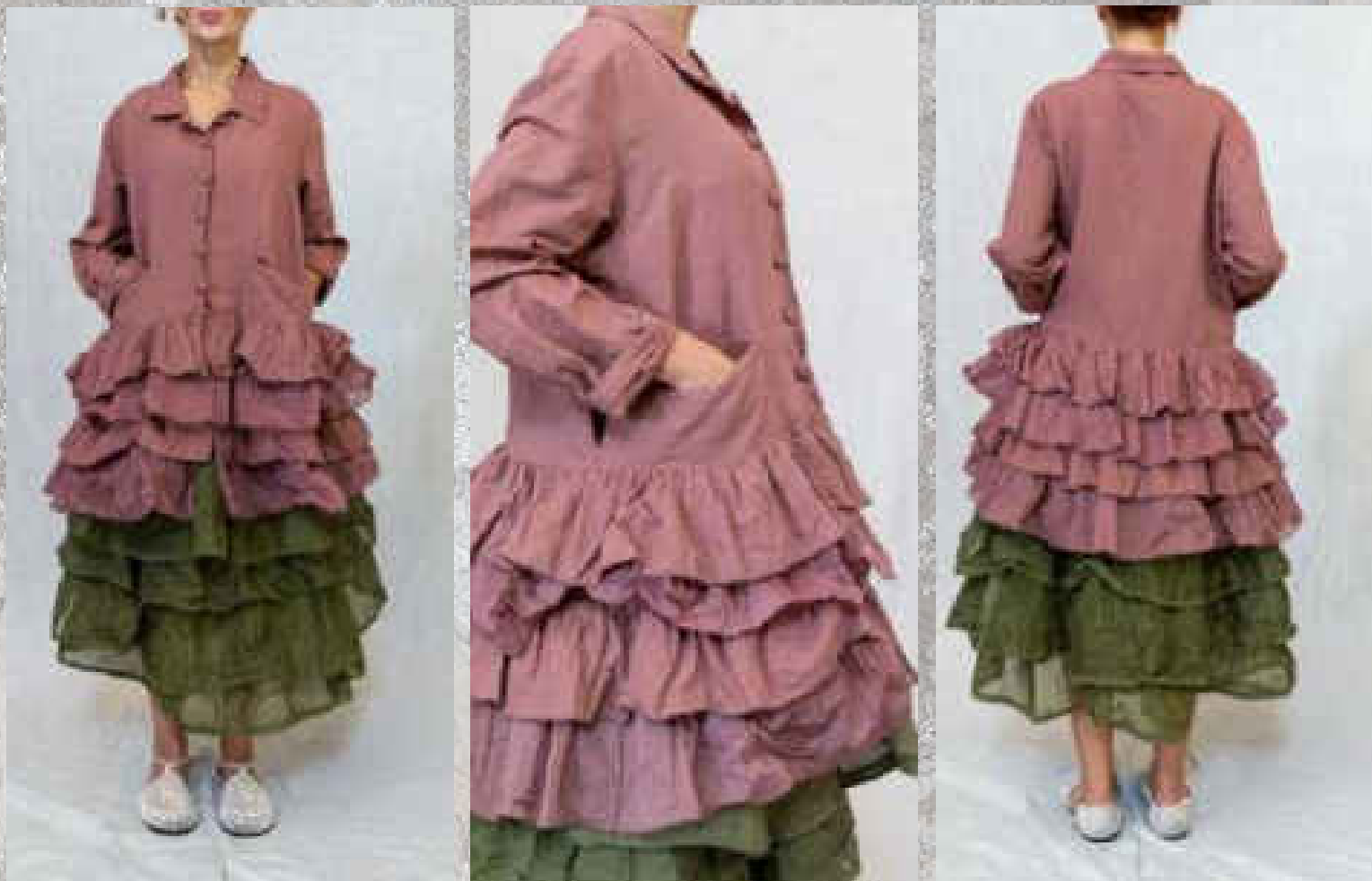
Veste ILONA BOIS DE ROSE