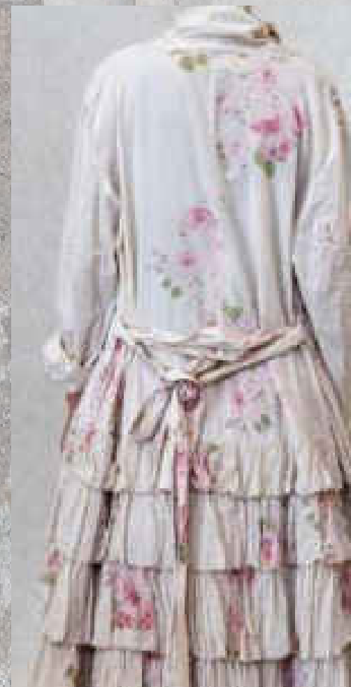
Veste longue TAMATA PRINT 2 - VOLANTS PRINT 1