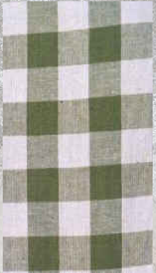
COTON RUSTIC CARREAUX VERT 100% COTON