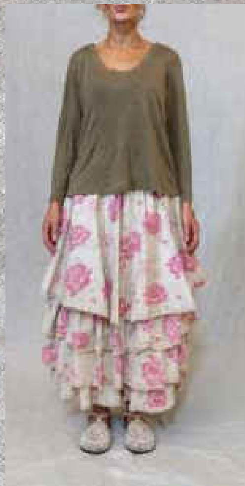
Jupon 100 % COTON MADELEINE PRINT 2

PRINT 1 SAUGE BOIS DE ROSE DRAGÉE / CRAIE Volants dentelles coton