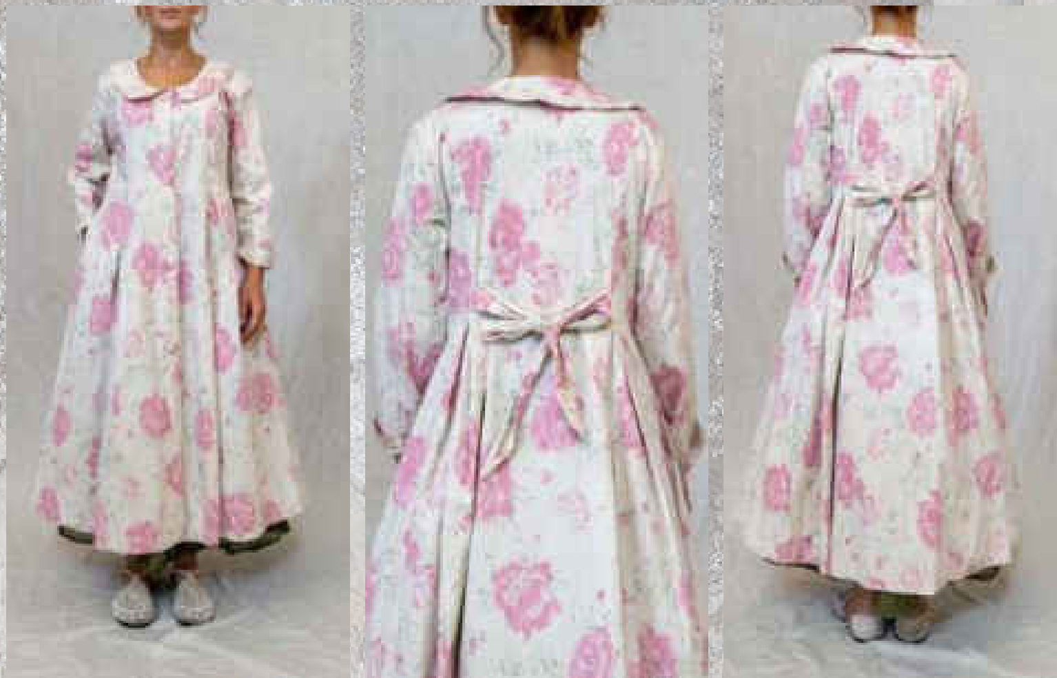
Veste LANA PRINT 2

PRINT 1 / PRINT 2 UNI SAUGE UNI BOIS DE ROSE