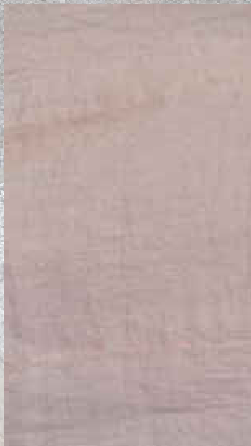
VOILE DE COTON DRAGÉE 100 % COTON