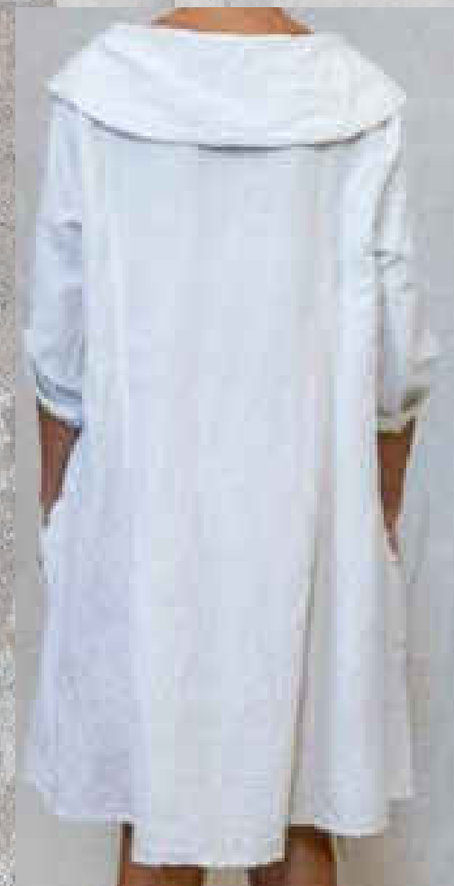
Robe / Tunique VAIM CRAIE