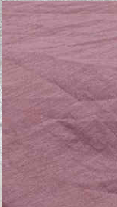
VOILE DE COTON BOIS DE ROSE 100 % COTON