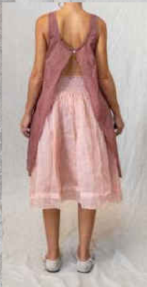
Tunique CÉCILE CRAIE